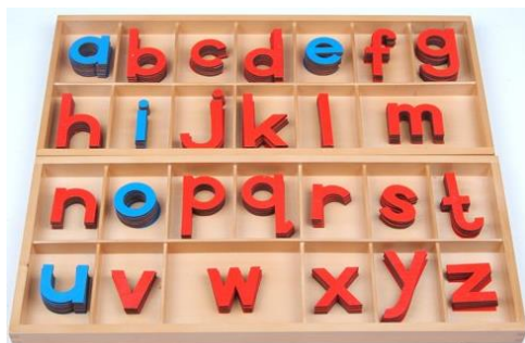
Imagem 1: Alfabeto texturizado