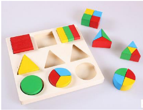
Imagem 5: Blocos geométricos de montar