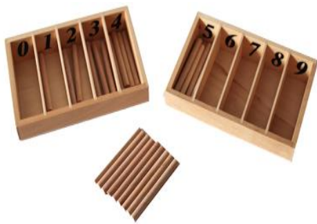
Imagem 3: Caixa de fusos