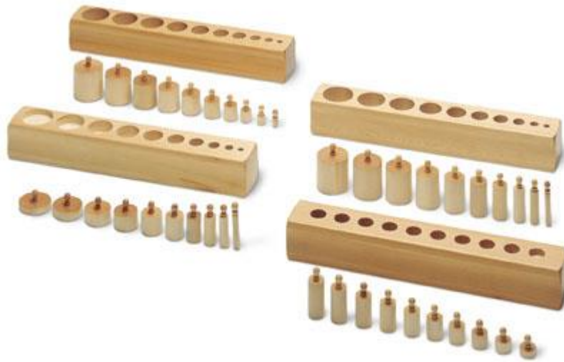
Imagem 9: Cilindros de madeira