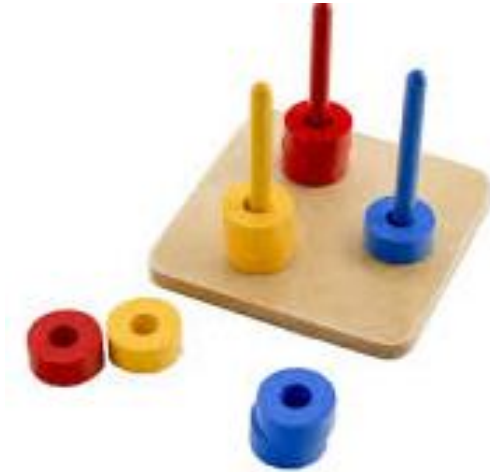
Imagem 7: Pinos de encaixe com cores primárias